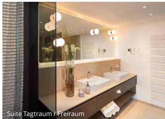
Suite Tagtraum / Freiraum

Sie erhalten bei uns Eintrittskarten für alle Bad Füssinger Thermen zum günstigen Sonderpreis.